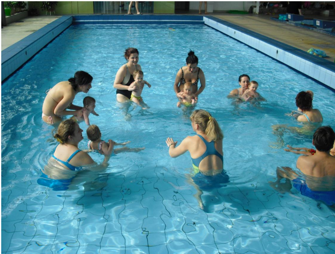
Kurz plavání rodičů s dětmi