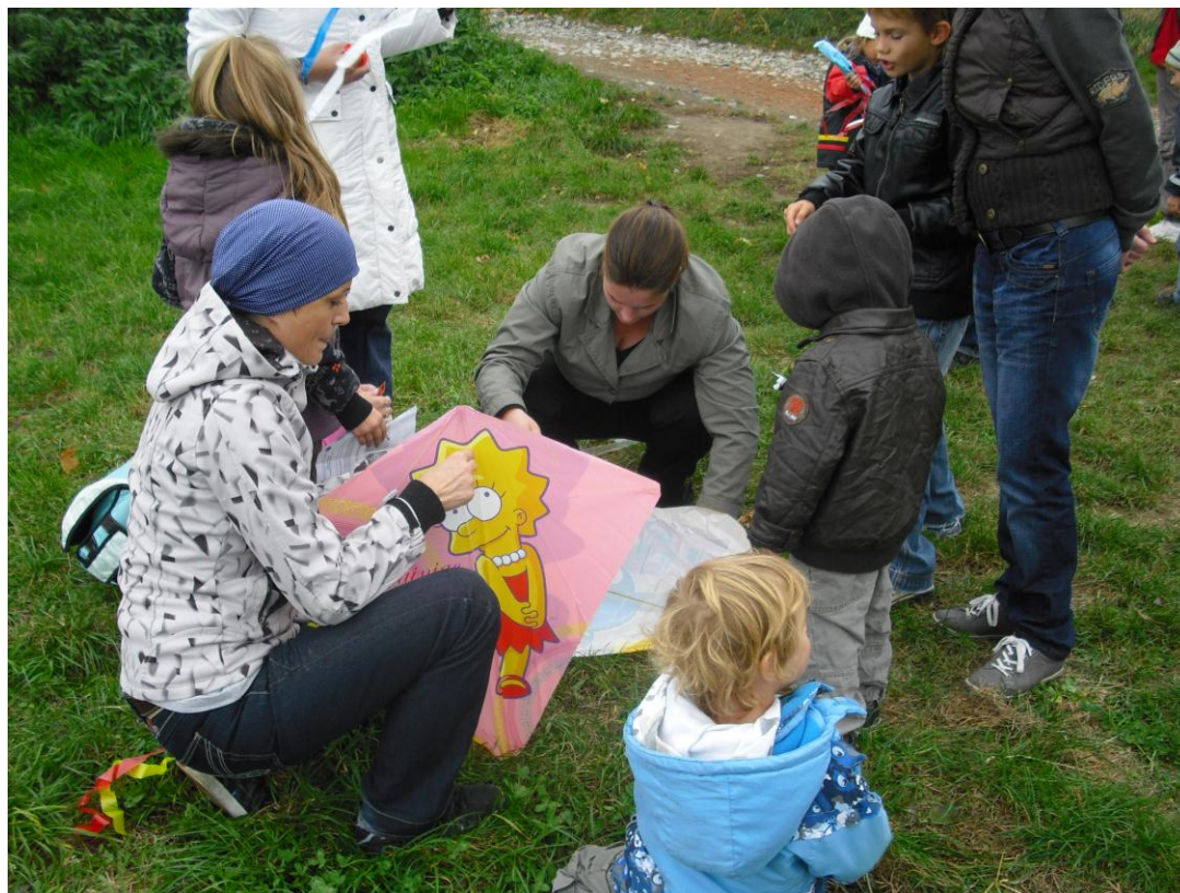
Drakiáda s rodinami z farnosti