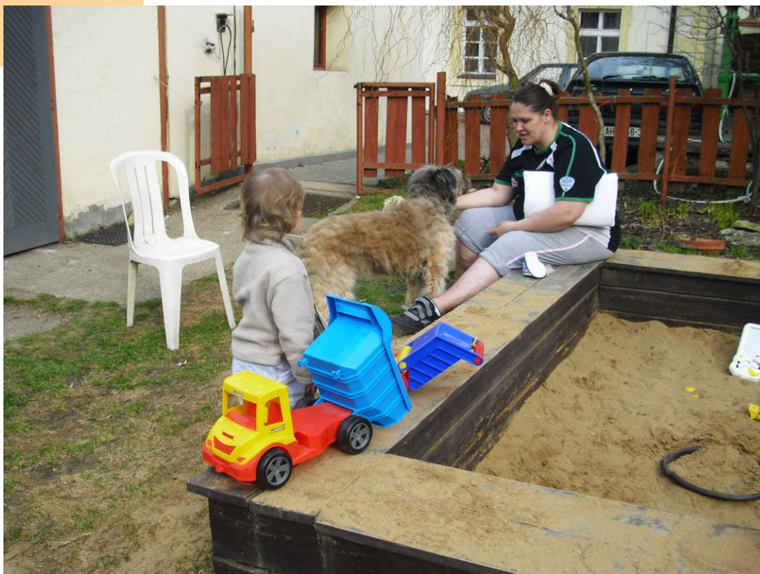
Na zahradě v Kolpingově domě